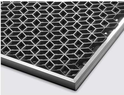
Produkt: SIXFORM STAR oder gleichwertig

Im Eingangsbereich werden als Schmutzfänger Fußabstreifmatten flächenbündig hergestellt.